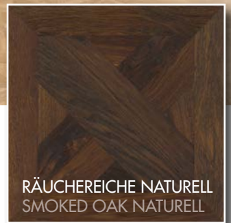
RÄUCHERICH SMOKED OAK NATURELL